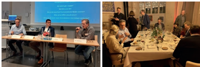
Eindrücke von der Jahrestagung 2023